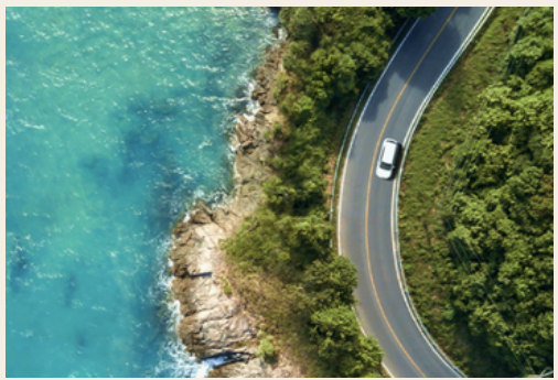
투숙객 쏘카 50% 할인 (파르나스 호텔 제주 쏘카존 보유 차량 한정)