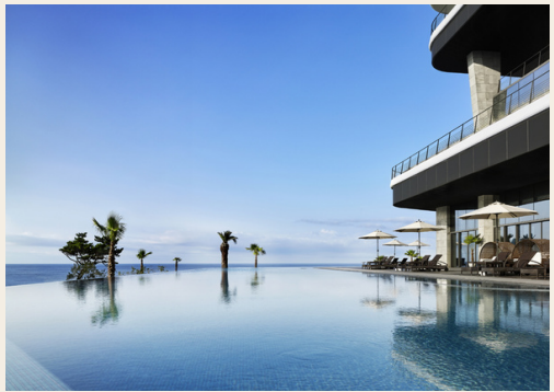
에스츄어리 풀 이용 (실내 수영장 포함)