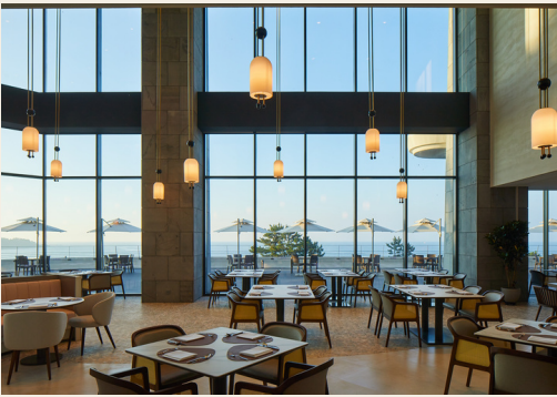
콘페티 이용 시 투숙객 할인