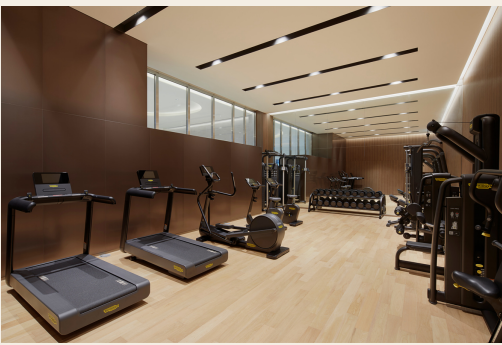
피트니스 클럽 이용